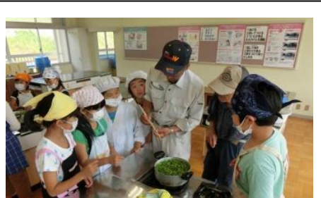
▲地域の方から学ぶ大豆学習