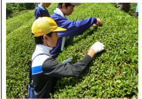
▲中学校生徒と茶摘み体験

保育園でつけた力を大切に、小学校でステップアップします。中学校の教科専門の教員が授業を行い、より専門的に学びます。中学校の茶摘みを体験します。