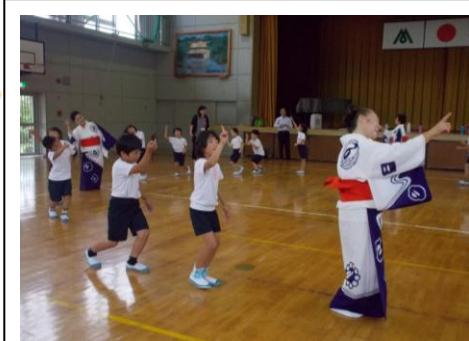
▲放課後子ども教室 盆踊り

下校後、保護者のお迎えがあるまで宿題をしたり遊んだりして過ごします。上之郷保育園の敷地内にあり、園児と触れ合う活動もあります。