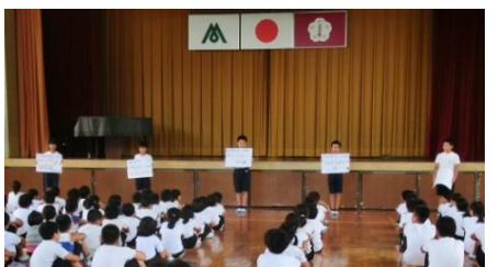
▲全校集会で発表する委員長