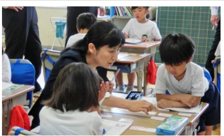
▲少人数によるきめ細やかな指導