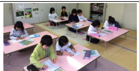
▲放課後児童クラブ

3年生以下の児童は下校までの時間を利用して、英語・尺八・詩吟・盆踊り等、様々な体験ができます。