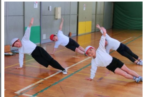
▲体育の授業における補助運動

スポーツテストの結果分析をもとに、つけたい力に合わせて補助運動を行い、力が付いてきました。