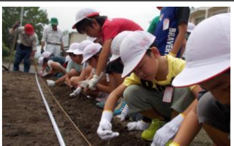
▲地域の方から学ぶ大豆学習