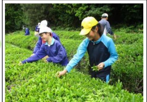
▲中学校生徒と茶摘み体験

保育園でつけた力を大切に、小学校でステップアップします。中学校の教科専門の教員が授業を行い、より専門的に学びます。中学校の茶摘みを体験します。