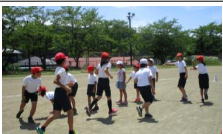
▲縦割りグループでなかよし競技会