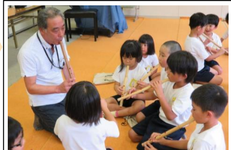
▲放課後子ども教室 尺八

下校後、保護者のお迎えがあるまで宿題をしたり遊んだりして過ごします。上之郷保育園の敷地内にあり、園児と触れ合う活動もあります。