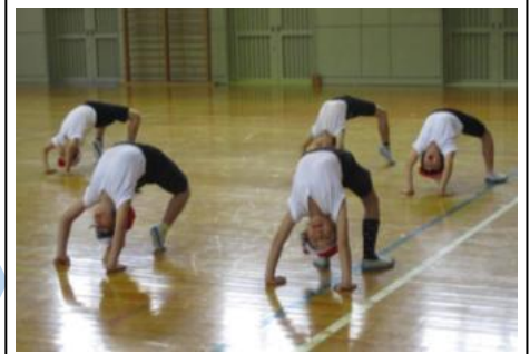
▲体育の授業における補助運動

スポーツテストの結果分析をもとに、つきたい力に合わせて補助運動を行い、力を付けます。