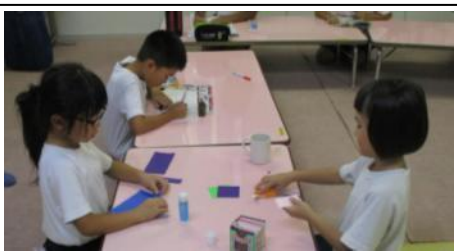
▲放課後児童クラブ

3年生以下の児童は下校までの時間を利用して、英語・尺八・詩吟・盆踊り等、様々な体験ができます。